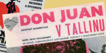
Plaadid ümbrikul on kasutatud fragmente filmi režiivihikust (Tallinnfilm, 1971).